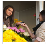
כל הדרכים לתת שירות טוב ללקוח עם מגבלות